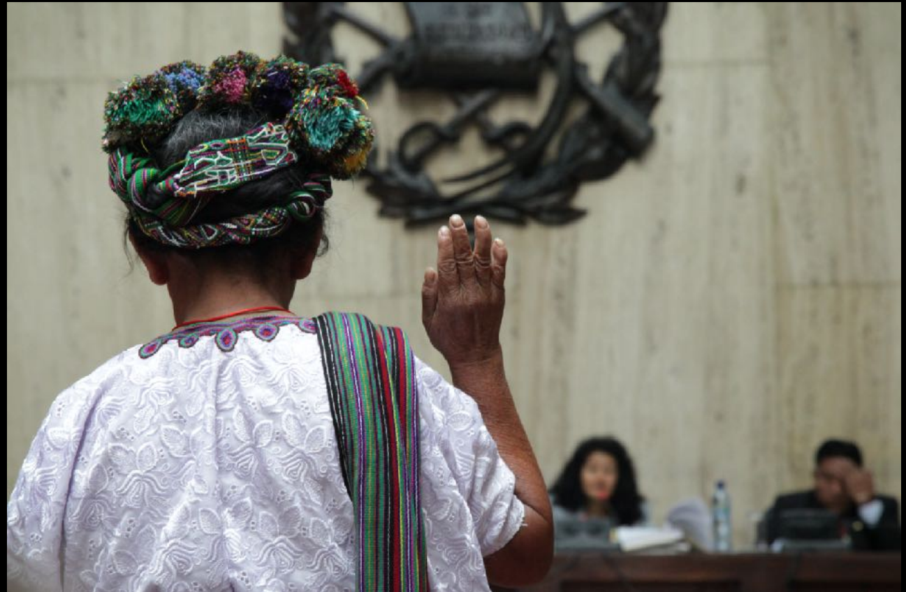
Juicio por genocidio contra Efraín Ríos Montt